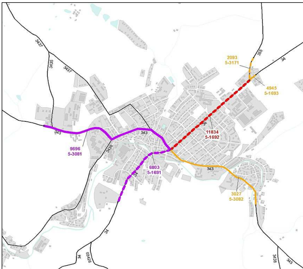
Obrázek 2-1 Intenzity dopravy ve městě Hlinsku v roce 2005