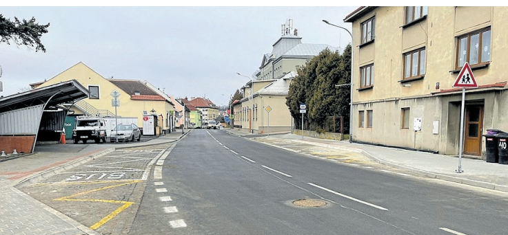
ŠIROKÁ REKONSTRUKCE ulice Resslera ve spolupráci se SÚS Pardubického kraje, zahrnující nové chodníky, kompletní výměnu veřejného osvětlení, výstavbu bezpečného přechodu pro chodce a dva zálivy pro autobusové zastávky mimo vozovku.