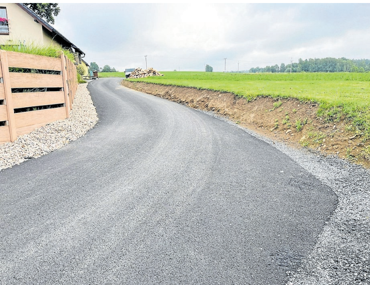
OPRAVA DLOUHODOBĚ ZCHÁTRALÉ komunikace u křížku v Blatné zpevněním podkladu a novým asfaltovým povrchem.