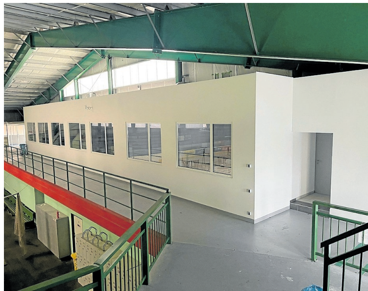
VESTAVBA nového zázemí pro hokejový klub HC Hlinsko v areálu zimního stadionu, včetně moderních zázemí pro hráče a diváky.