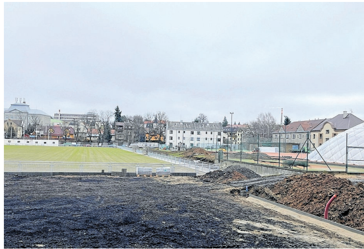
KOMPLETNÍ REKONSTRUKCE fotbalového hřiště s novými travníky, povrchy tenisových a volejbalových kurtů, obnova oplocení, kanalizace a zpevněných ploch v okolí sportovního areálu Olšinky.