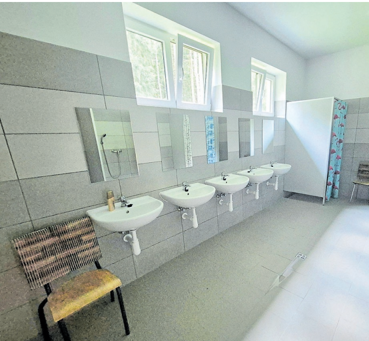
PRVNÍ ETAPA REKONSTRUKCE sociálního zázemí tábora Svratouch s novými rozvody vody a kanalizace, obklady, dlažbami a sanitárními zařízeními.