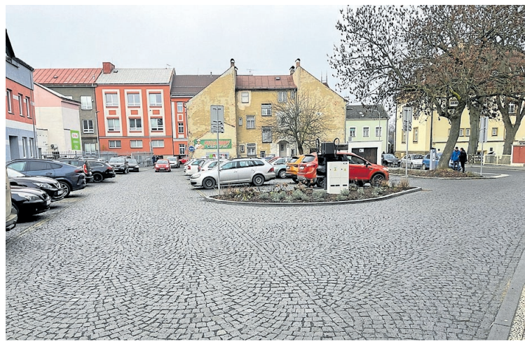
KOMPLETNÍ REKONSTRUKCE PARKOVIŠTĚ za Komerční bankou a přilehlých komunikací, zahrnující demolici starých podkladových vrstev, nové zpevnění a povrchové úpravy včetně instalace nabíjecí stanice pro elektromobily.