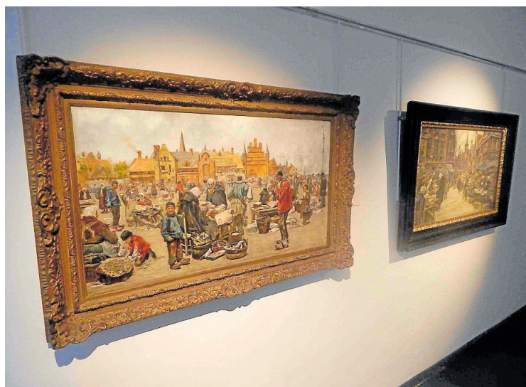
Pohled na hlavní motiv výstavy Hanuše Schwaigera