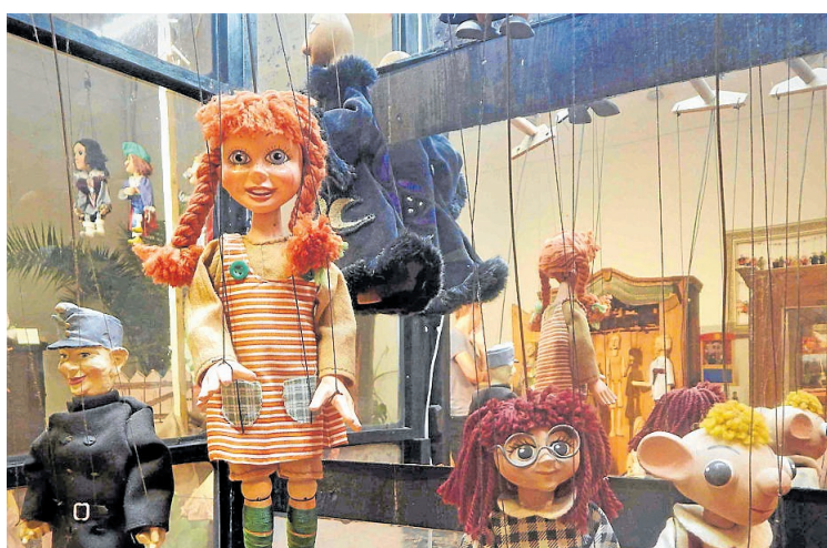
Loutky ze soukromé sbírky