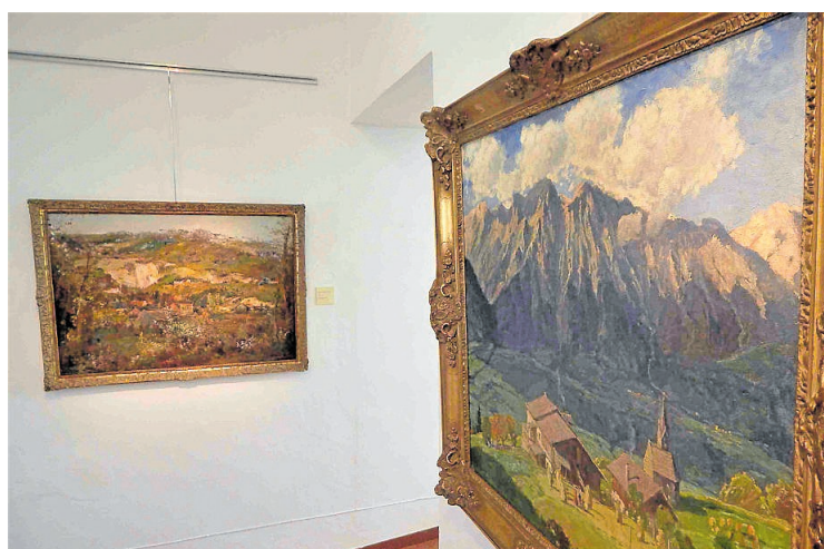
Alpská krajina Oldřicha Blažička