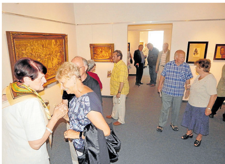
Zahájení 58. ročníku Výtvarného Hlinecka – 23. 6. 2017