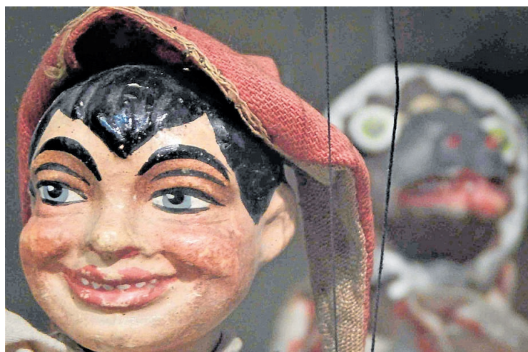
Detail Kašpárka z rodinného divadla zapůjčeného skanzenem Vysočina