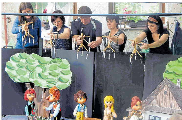
Loutkové představení zahájilo výstavu Za loutkami do muzea – 30. 6. 2017